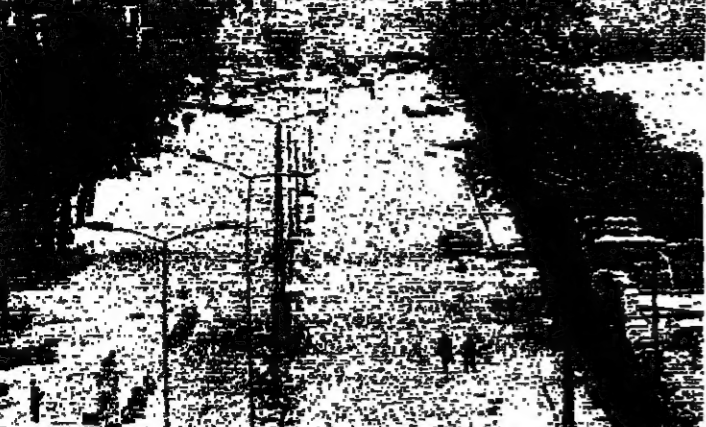
طريق المتحف - البربير